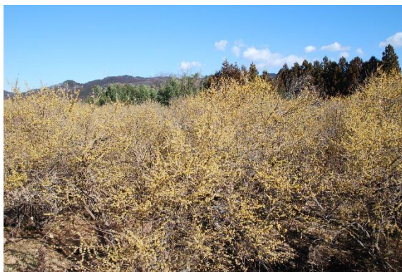
全体を撮るとぼけてしまいます