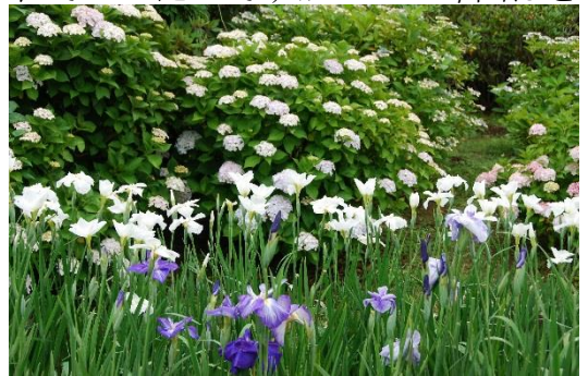
花菖蒲とアジサイ

花菖蒲は水のあるいくつかの場所にポットに植えられ、それを集めきれいな花を咲かせていました。20万本は結構楽しめました。アジサイは、園内いたるところに植えられており、小さい木が多かったので、これから数年後が楽しみなようです。まだバラが咲いていたり、ゆりの花等を見て楽しむことができました。