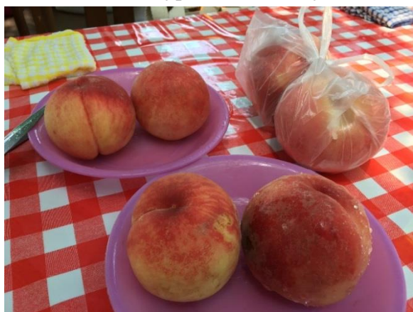
ビニル袋は採った桃 お皿の桃はこれから食べる桃

8月上旬の平日に、桃狩りに行ってきました。行き先は山梨県の笛吹市。圏央道から中央高速に入り、一宮・御坂インターチェンジを降りて、5分程度でしょうか。圏央道から中央道に入るところで渋滞に巻き込まれましたが、我慢できるものでした。お目当ての場所は、御坂農園グレープハウスです。一昨年と二度目の訪問です。桃狩り（2個）と、食べ放題で料金は1300円。前回美味しかった味が忘れられずに今回も来たということです。バスに乗って畑まで行き、桃狩りです。写真では見えませんが、中に入るとまだ残っています。この畑は、もう残り少なく、よい桃は採られてしまっているのですが、がんばって探します。脚立に乗って高い所のものを2個ゲット。お店に戻って、食べ放題開始。最初に欲張って大きい桃をとったら、少し固め。小さくてもやわらかいものを食べたほうがおいしいか？何だかんだと言いながら、7個を完食したでしょうか。もう何も食べられません。「おいしくいただきました。」満足・満足。人生の中で食べ放題に挑戦したのは桃だけかな。