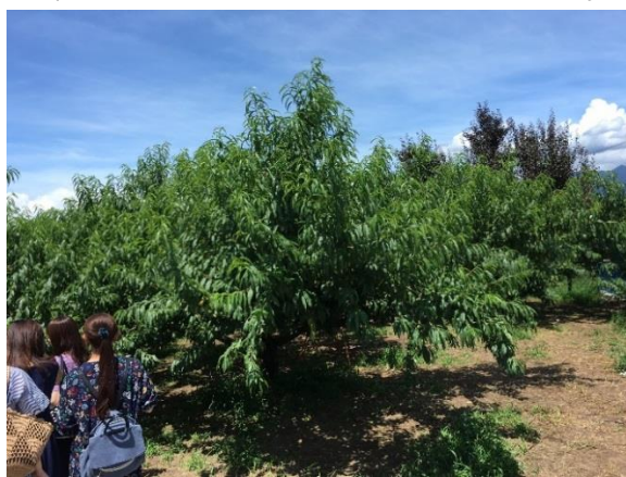
桃の木 手前の木はもぎとられた後