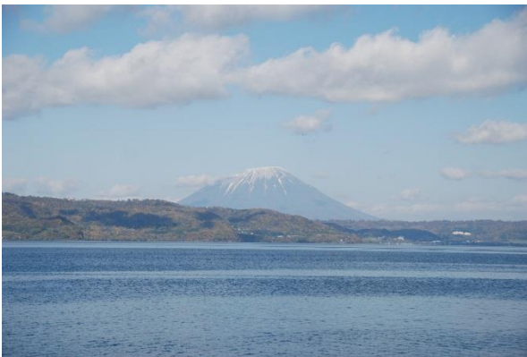
羊蹄山をバックに洞爺湖