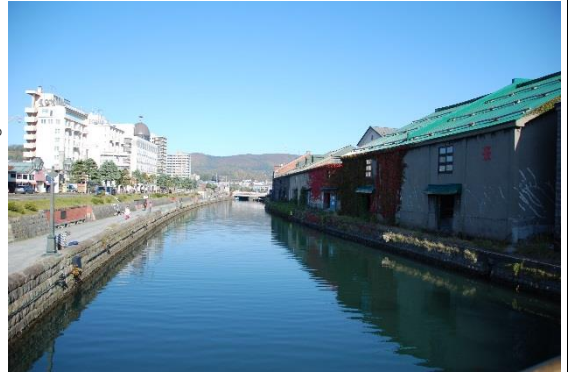
小樽といえば運河。ホテルの目の前

全行程を通して、紅葉の美しさを堪能することが出来ました。小樽といえばたくさんありますが、新鮮なお魚のお寿司でしょうか。ホテルで紹介されたところに行ってきましたが、そんなにでもなかったかな？というところでしょうか。特別おいしいとは感じませんでした。(これははずれかな) もう一つ、ルタオ本店でダブルフロマージュをいただきました。(ケーキ)これはおいしかったです。冷凍ではなく、生ですからやっぱりおいしさは倍増でしょうか。