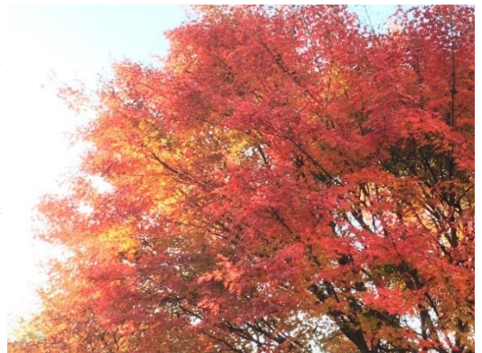
散歩の途中きれいだったので

今後、大掃除にクリスマス等行事もありますので、1年の締めくくりをしながら、新しい年を迎えていただきたいと思います。