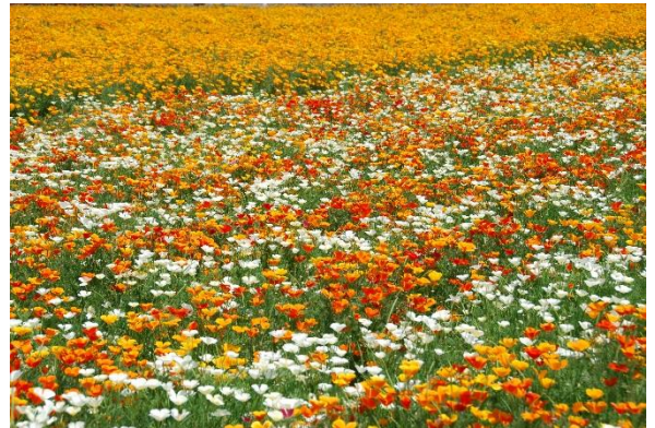
カリフォルニアポピー

花の色はピンクと言われているますが、紫色の薄い感じで、花は直径3cmぐらいだったでしょうか。初めて見る花でしたが、とても可憐な感じの花びらでした。心を豊かにしてくれるポピー達でした。