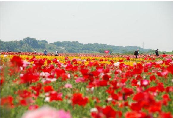
定番の赤いポピー

連休からいろいろと忙しく、なかなか出かけることができませんでした。苑のエレベーター工事も無事に終わり、休みがとれたので鴻巣のポピーを見に行ってきました。宣伝では、「鴻巣市の日本一広いポピー畑。その場所は市域の南西にある荒川の河川敷、馬室の地区にあるポピー・ハッピースクエアです。ポピーの栽培面積は約12.5ヘクタール、花株の本数は約3000万本。見渡す限りどこまでも続く美しい花畑。広大な河川敷を覆う鮮やかな煌きは壮観です」となっています。実際に歩いてみるとやはり広がったです。県外ナンバーの車も見られ、日本一というセールスがきいているのかなと思いました。当日は、雲一つない晴天に恵まれ、定番の赤のポピー、そして黄色のカリフォルニアポピー、今年から栽培されたそうですが、「麦なでしこ」もきれいな花をさかせていました。