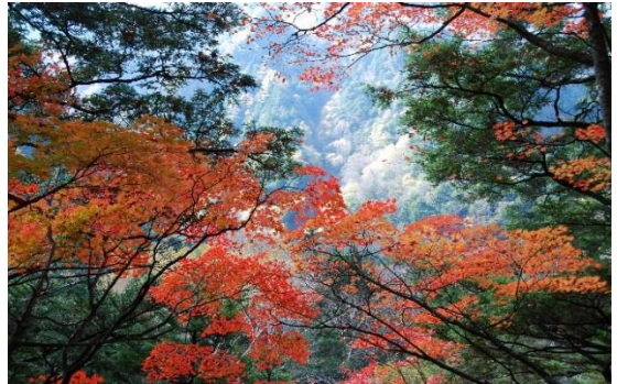
上高地 途中の紅葉をパチリ！

二日目は、上高地です。7～8年前に夏に行ったときは、曇りだったのでそのリベンジです。沢渡の駐車場でバスに乗り換え、上高地バスターミナルまで行きました。今回は、河童橋から明神池を目指しての散策です。途中途中写真を撮りながら、景色に見とれたりしながら約1時間で明神池に到着です。明神池は穂高神社の敷地内にあり、神聖な池と呼ばれています。心を洗われるような気持ちになって、河童橋まで戻ります。帰りの方が少し早かった感じです。橋まで戻るとかなり混雑していました。河童橋の上は写真撮影で行き来ができないくらい混んでいます。飛び交う言葉は日本語ではなく、たぶん中国語です。観光できている日本人のほうが少ないような感じです。昼食を摂り、一息入れて大正池方面に歩き