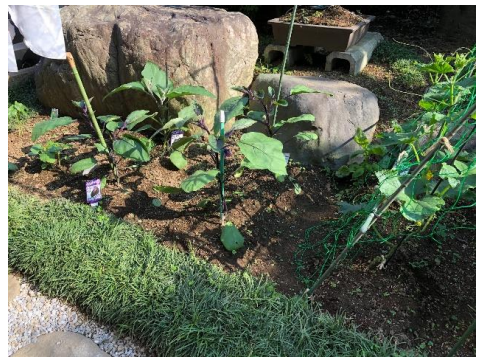
ミニ菜園の様子 右からキュウリ、ナス、オクラ

今年も我が家の狭い庭（ミニ菜園）に少しばかりの野菜を作っています。今年は、キュウリ4本、ナス4本、オクラ2本、プランターと鉢にミニトマト3本を植えました。毎年やっていますが、収穫は今一でしょうか。ミニトマトは毎年のように、身が割れてしまい、味もよくないため、今年は雨よけを作成し、水分